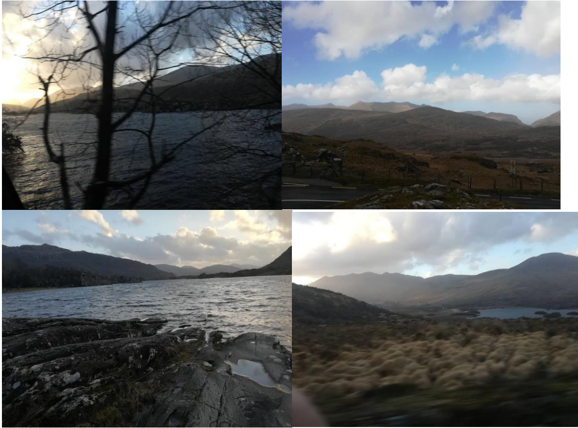
Slika 6: Nekaj utrinkov iz popotovanja