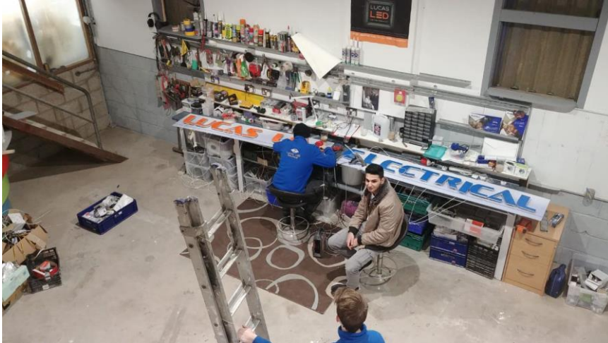
Slika 1: Napis v delu

V mesecu Februar smo imeli nekaj zanimivih projektov: Mentor je želel obuditi svoj stari napis z novimi LED lučmi. Delo je vzelo nekaj dni in živcev, toda končni rezultat je poplačal ves vložen trud.