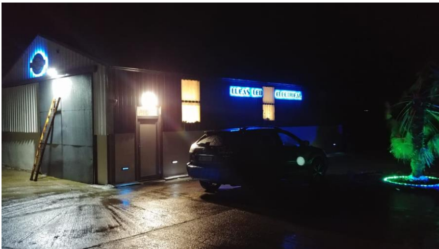
Slika 2: končni rezultat