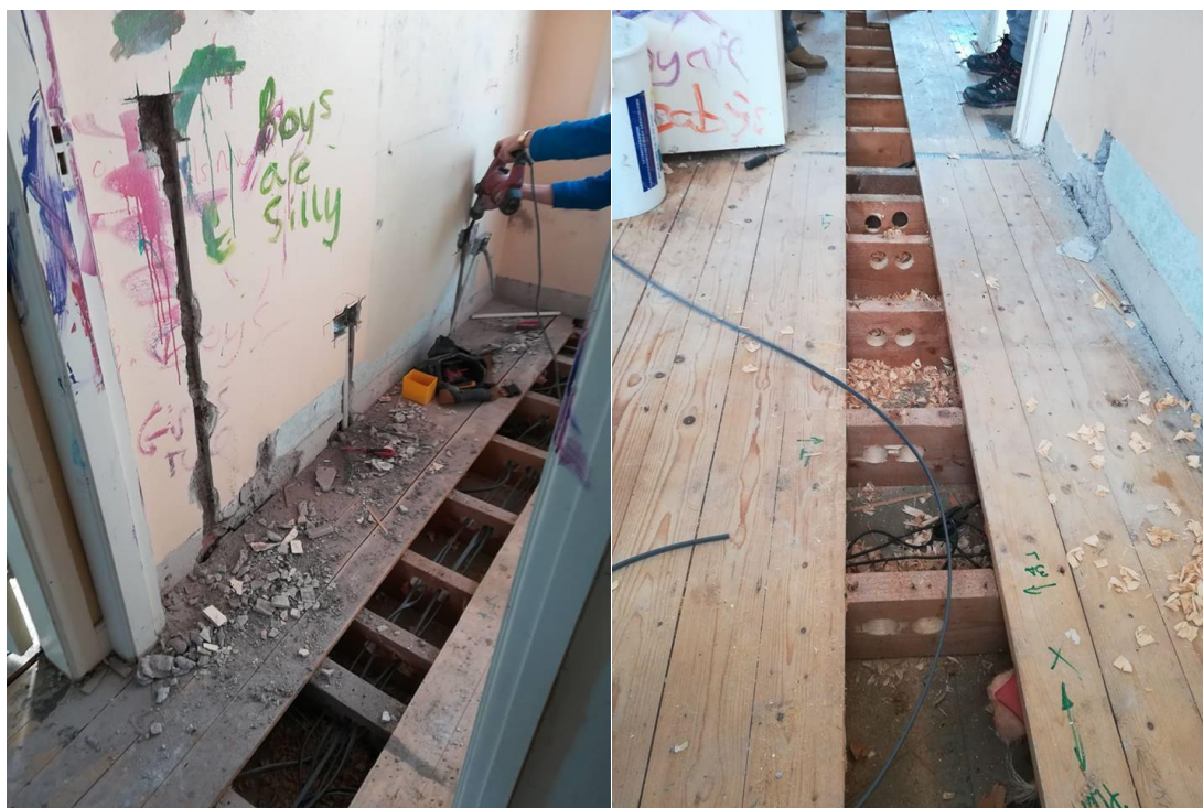
Slika 4: prva prenovitvena dela