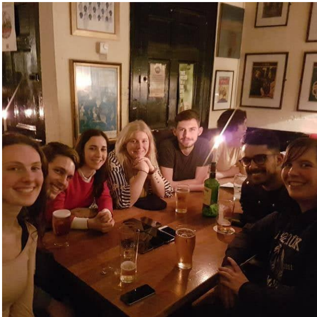
Slika 5: družabni večer z ostalimi tujimi študenti

Toda ta mesec ni bil obarvan zgolj z delom. Partnership je nek večer organiziral spoznavni večer med študente, ki so tu z istim namenom in drugih evropskih držav. Večer je bil izjemno pester in ob spremljavi žive irske glasbe spoznal kar nekaj ostalih ljudi iz različnih držav. Po nekaj dneh smo prišli do ideje, da bi najeli avtomobile in odšli na »road trip«. Tako smo si vzeli en dan in se odločili za krajše popotovanje po zahodnem delu Irske. Sprva nam vreme ni bilo naklonjeno toda kmalu se je pojavilo sonce in polepšal že tako lepo Irsko pokrajino.